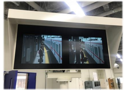
実際の見え方と同等のITV