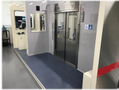
扉の開閉が可能な車体