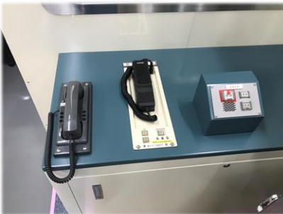
実車と同じ機器を設置