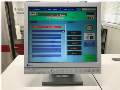
タッチパネルで簡単操作